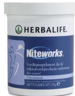
Niteworks™ #3150 – 48.75 VP

Een speciale combinatie van ingrediënten ter ondersteuning van de stikstofoxideproductie